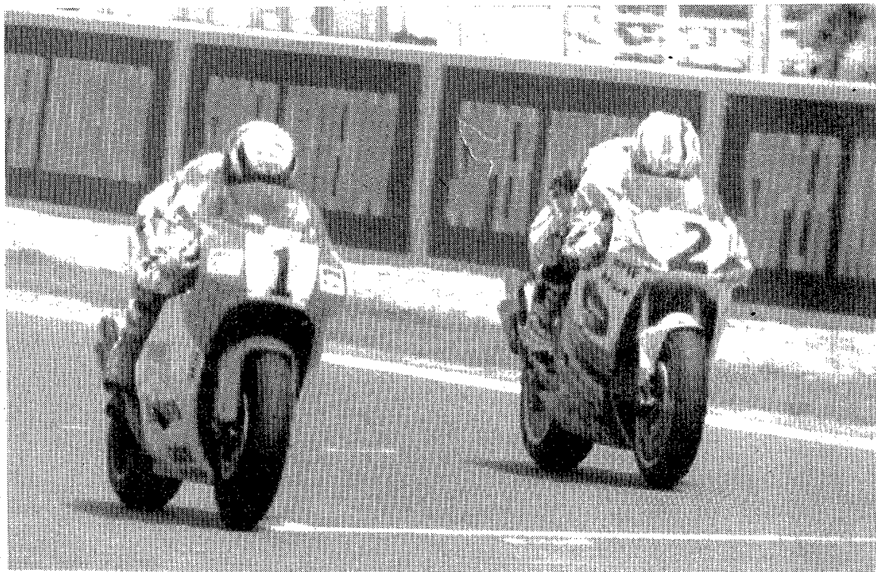
La emoción vuelve • Así batallaron en el Circuit el pasado año Rainey y Doohan. Este año, Crivillé, Schwantz y quizás Alexander Barros deben estar con ellos. Si lo consiguen, la afición entrará en éxtasis • FOTO: EFE

El esfuerzo de la organización en el precio de las localidades, manteniendo las tarifas del pasado año y habilitando unos precios especiales tanto para la tribuna de meta como para los menores de 16 años, demuestra que el Circuit de Catalunya apuesta fuerte por el motociclismo, un deporte que en España está valorado como en ningún otro lugar del mundo. La mejor prueba es que disfrutamos de dos pruebas puntuables para el Mundial.