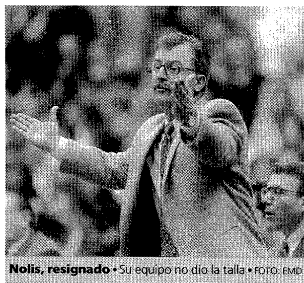
Nolis, resignado • Su equipo no dio la talla